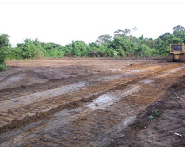
Photos des travaux préliminaires de défrichage du site entrepris au Terminal Minéralier de Lolabe en décembre 2013.